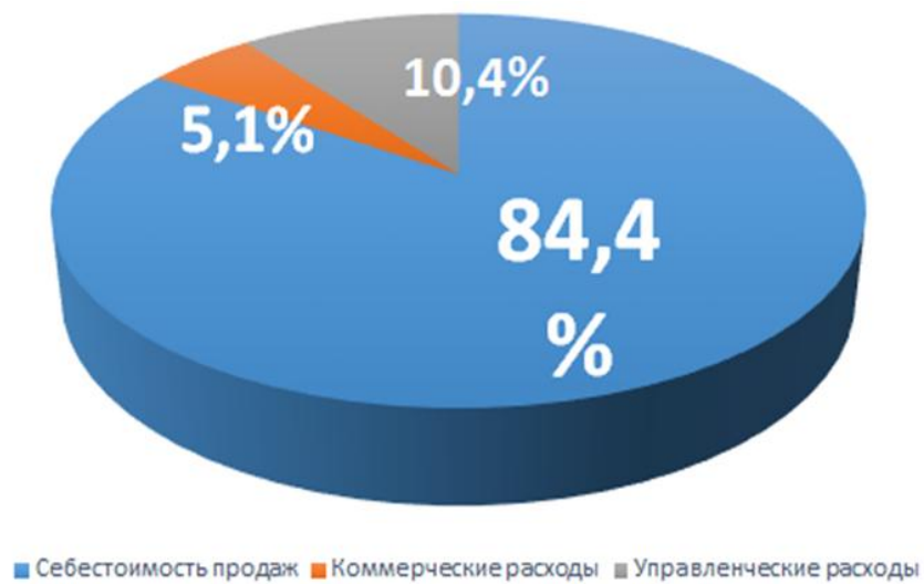
Рис. 2.2. Структура полной себестоимости