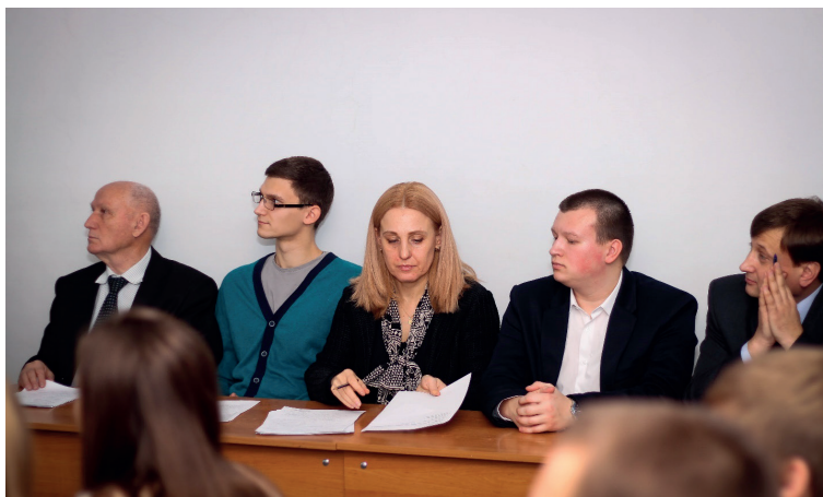
Идет научное заседание

2015 году приняло участие – 67 человек. В дальнейшем ежегодно принимало участие от 40 до 60 человек.