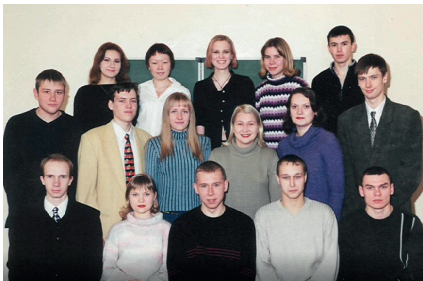
Первая группа очного обучения

- это возможность поблагодарить тех, кто за эти годы внес существенный вклад в подготовку специалистов для сферы го- сударственного и муниципального управления.