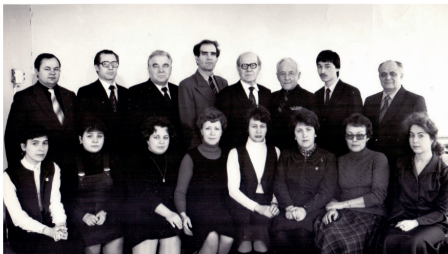
Кафедра политической экономики, 1985 г.