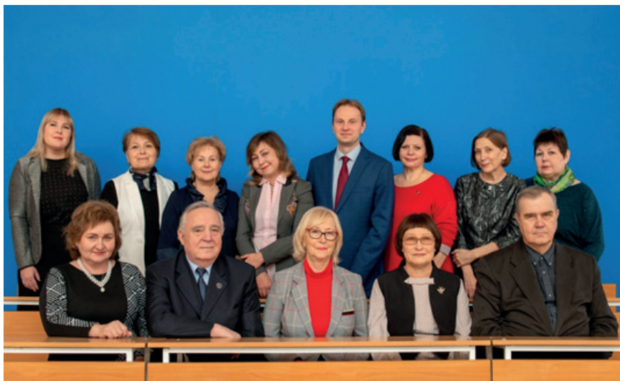
Кафедра экономики, 2019 г.

Ученые со сложившимися научными интересами способствуют формированию у студентов вкуса и навыков к исследовательской работе. Студенты участвуют в кафедральном сборнике научных статей. По окончании университета наиболее способные рекомендуются для приема в аспирантуру кафедры или дальнейшего обучения в магистратуре.