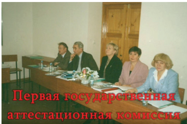
Первое заседание государственной аттестационной комиссии кафедры государственного и муниципального управления