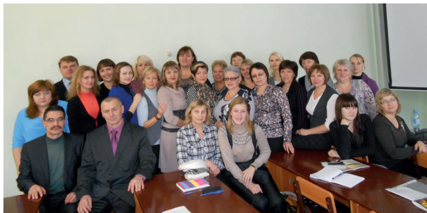
Заседание СНО «Сила слова»