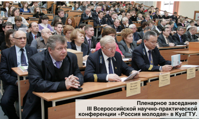
Пленарное заседание III Всероссийской научно-практической конференции «Россия молодая» в КузГТУ.

Формирование таких компетенций обуславливает адаптацию для этих целей не просто отдельных направлений повышения квалификации и переподготовки слушателей, но и информационно-образовательной среды в целом, создание условий для свободы творчества и самовыражения каждого слушателя.