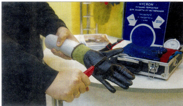
Декабрь 2013 года: Научно-технический центр инноваций в области охраны труда и промышленной безопасности, одна из целей которого повышение эффективности научной работы кафедры аэрологии, охраны труда и природы.