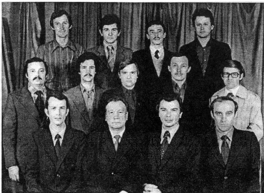
Кафедра "Эксплуатация автомобилей", 1980 год