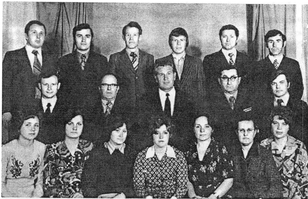
Кафедра «Технология машиностроения», 1975 год