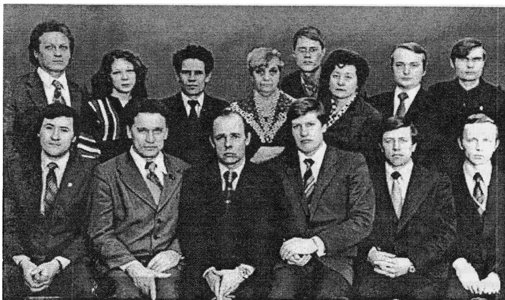
Кафедра «Прикладная механика», 1980 год