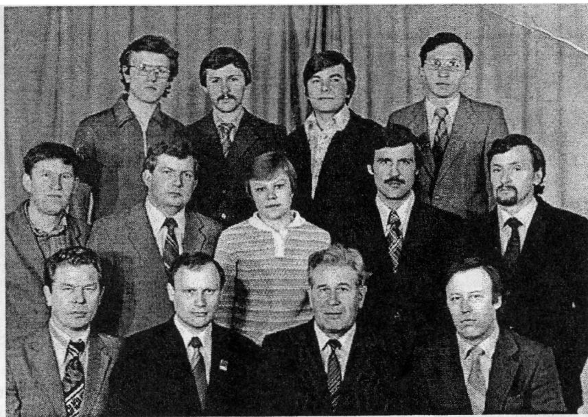
Кафедра "Металлорежущие станки и инструменты", 1985 год

В 1980 году произошло очередное разделение кафедры ТМС. Была выделена кафедра "Металлорежущие станки и инструменты" (МСИИ). Все