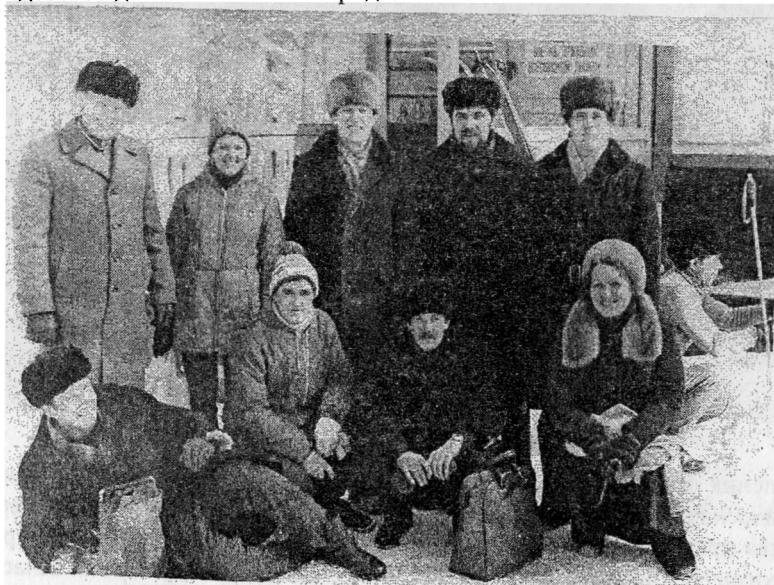
Сотрудники ХТФ на соревнованиях на лыжной базе КузПИ

Особой статьёй являлись студенческие строительные отряды (ССО). Химфак направлял свои ССО практически по всей стране – от Крыма до Сахалина. Стройотряд “Химик” работал на многих стройках Кемеровской области, осваивая значительные объёмы производств во время летних каникул. В последние годы стройотрядовское движение вновь возродилось.