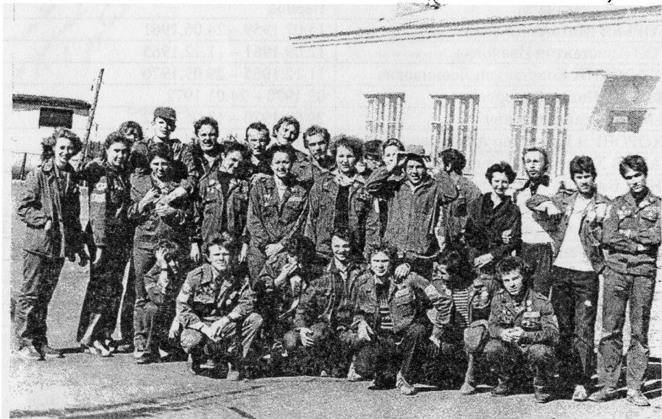
Студенческий строительный отряд КузПИ

Студентам химфака в 60-х – 80-х годах приходилось кроме учёбы активно заниматься общественно-полезным трудом – это и традиционная для советского времени «картошка», ленинские субботники по уборке территории вокруг здания факультета и его лабораториях, помощь в строительстве нового здания для химического факультета, промышленных объектов, в том числе и новых производств НКХК.