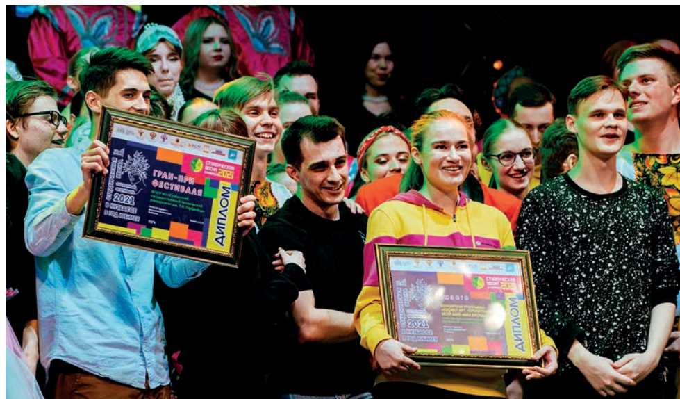
12-й Гран-при фестиваля «Студенческая весна в Кузбассе» в копилке технического университета.

– Вы большие молодцы. Мы гордимся вами, – обратился к молодежи губернатор Сергей Цивилев. – Студенты-медики Кузбасса в прошлом году работали в красной зоне. Студенты строительных специальностей задействованы на главных стройках Кузбасса. Студенты-спортсмены успешно выступают на соревнованиях самого вы-