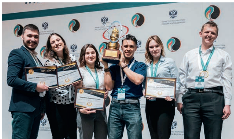
Победа МНО «Химик» на всероссийском конкурсе – показатель высокого уровня подготовки студентов ИХНТ КузГТУ.

– Гармоничная командная работа стала решающей для нашей победы. А еще мы нестандартно подошли к решению задания блиц-турнира: сняли видеоролик в режиме реального времени, разыграли сценку на тему «Магнит-