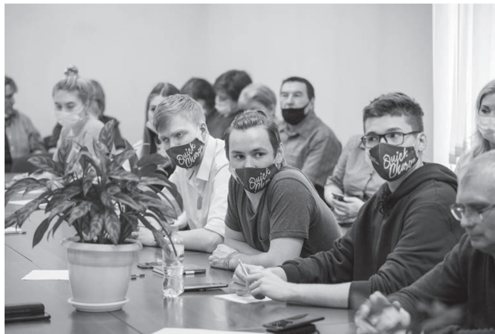
Студенчество – это не только лекции, лабораторные и сессия, но и яркая общественная жизнь.