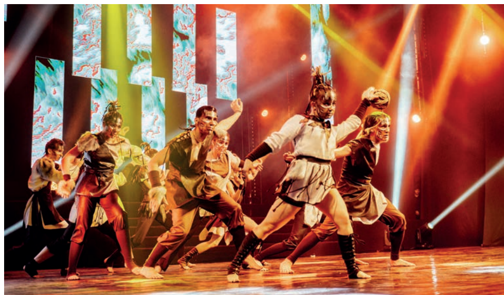
Студия экспериментального танца «Новый формат» с номером «Дым» – лидер в номинации «Современный танец» на областном фестивале.