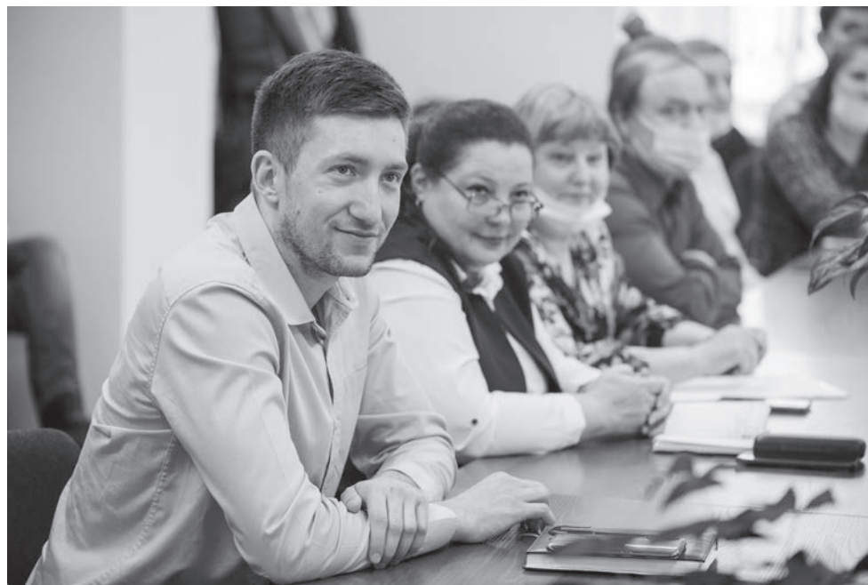
Образование должно включать не только знания и навыки, но и духовные, моральные ценности, которые формируют личность, считают участники круглого стола.

Круглый стол «Вуз как воспитательное пространство» прошел в формате активного диалога. Итогом стало общее решение продолжать общение и вести системную работу в реализации воспитания как неотъемлемой части образовательного процесса КузГТУ.