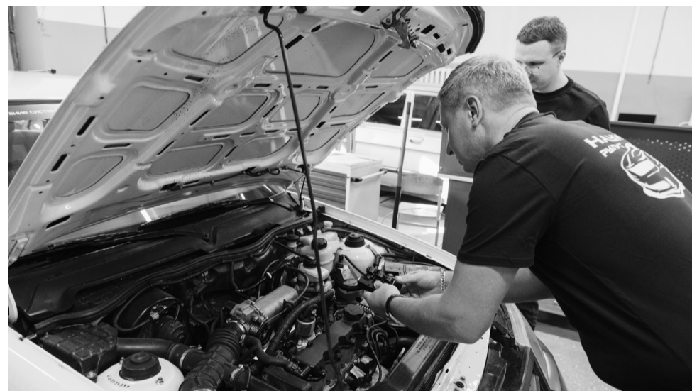
Главная задача проекта – снизить уровень вредных выбросов в атмосферу и расход топлива.

Во время эксплуатации автомобиля разработчики оценят как чисто бензиновый двигатель, так и модернизированный с добавлением водорода. В первую очередь будут учитывать 4 фактора – работа электронного блока управления двигателем, экологичность, эффективность работы, а также видеоконтроль. Ученые измерят и сравнят выбросы CO и CnHm. NOx, компрессию в цилиндре двигателя, расход топлива. С помощью Мотортестера будет оцениваться эффективность работы цилиндров, а микроскопическая видеокамера будет фиксировать камеру сгорания двигателя – состояние клапанов, поршня, головки блока цилиндров и величину нагара.